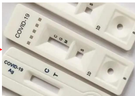
塑优案® 低成本 PS/PP材料